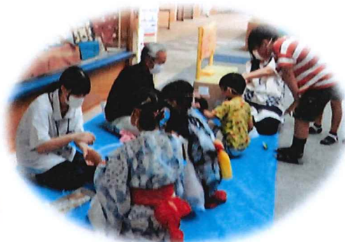
昨年の Summer チャレンジボランティアの様子