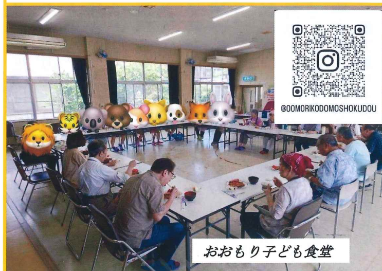
おおもり子ども食堂