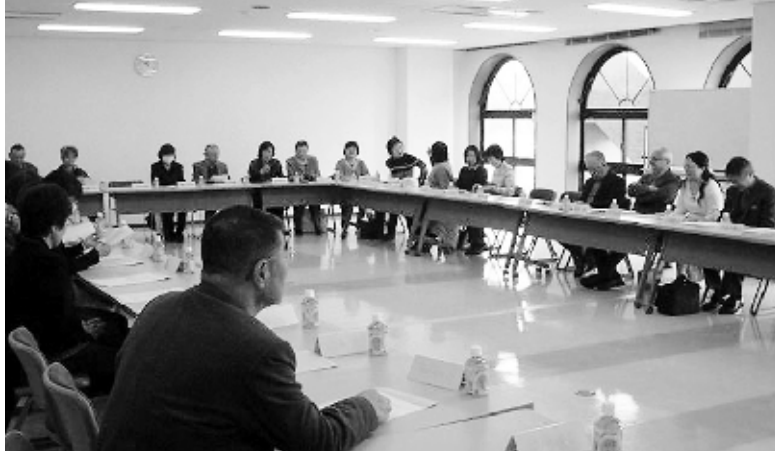
▲本塾支部設立総会が行われました

社会福祉法人 印西市社会福祉協議会 〒270-1325 印西市竹袋614-9 印西市総合福祉センター内 ☎0476-42-0294 FAX 0476-42-0338 E-mail info@inzaishakyo.jp URL http://www.inzaishakyo.jp