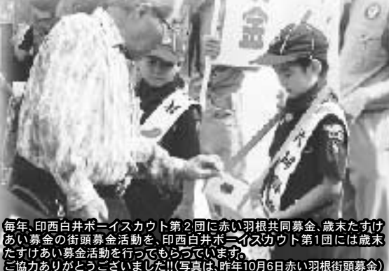
毎年、印西白井ボーイスカウト第2団に赤い羽根共同募金、歳末たすけあい募金の街頭募金活動を、印西白井ボーイスカウト第1団には歳末たすけあい募金活動を行っていただいております。ご協力ありがとうございました!!(写真は、昨年10月6日赤い羽根街頭募金)

昨年10月1日から12月31日を実施期間とする「赤い羽根共同募金運動」、12月1日から12月31日までを実施期間とする「歳末たすけあい募金運動」を展開し、皆様からの温かいご協力の募金をいただき誠にありがとうございました。 10月5日の市内各駅に於ける街頭募金からはじまり、戸別募金運動では町内会、自治会、町会、区のご理解とご協力をいただき、市内各所で活動が行われてきました。 市内で支援を必要とする世帯への見舞金や、障がい者団体への活動助成金を配付させていただきました。平成24年にお寄せいただいた募金は、一旦、全額が千葉県共同募金会に集められ、平成25年度の千葉県内の社会福祉施設等への施設整備費等として配分されます。 なお、印西市においても、社会福祉協議会に募金