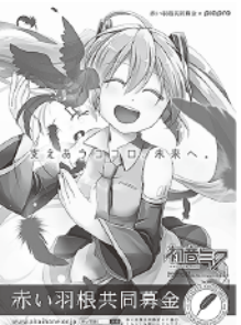
赤い羽根共同募金 啓発ポスター

赤い羽根募金と同様に、12 月から始まる歳末たすけあ い募金につきましても、皆さ まのご協力をよろしくお願 い致します。