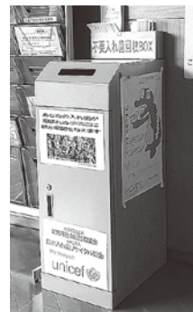
フレンドリープラザの回収BOX