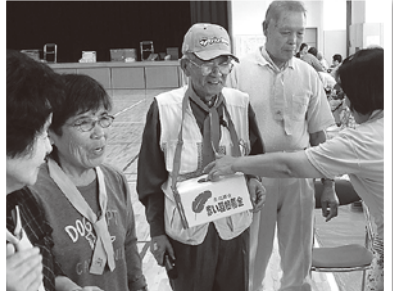
▲高齢者クラブ連合会本笠支部

また、12月1日からの歳末たすけあい募金では、戸別募金の他、12月6日・13日にはボーイスカウト印西白井第1団及び第2団のみんなで市内商業施設での街頭募金など皆様からお寄せいただいた募金により、市内で支援を必要とする世帯への見舞金や障害者団体・障害者施設への活動助成金を配付いたしました。平成27年度 昨年10月1日から12月31日に「赤い羽根共同募金運動」、「歳末たすけあい募金運動」を展開し、皆様からの温かいご協力をいただき誠にありがとうございました。戸別募金運動では、町内会等のご理解とご協力により多くの募金を頂くことができました。また、10月5日・9日・15日・16日には市内の中学生・高校生と支部社協の方達による、街頭での街頭募金や高齢者クラブ連合会、支部社協の行事での募金活動の実施、募金箱の設置など多くの皆様から募金のご協力をいただきました。