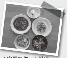
▲実習で作った料理