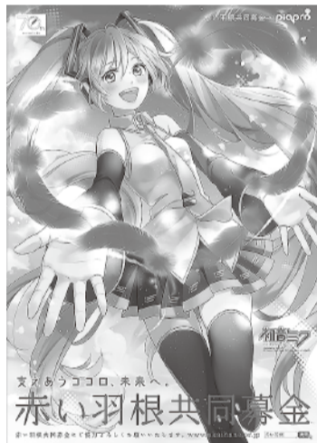
▲今年度 赤い羽根共同募金ポスター

円の募金がお寄せされました。いただいた募金は「歳末たすけあい募金配分委員会」で決定した配分計画に基づき、年末に地域の民生委員児童委員のご協力により、交通等遺児や準要保護世帯の児童生徒への見舞金の配付や、障がい者団体・障がい者施設への助成を行いました。 赤い羽根募金と同様に、12月からは始まる歳末たすけあい募金につきましても、皆さまのご協力をよろしくお願いします。