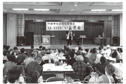
大森・永治支部 いも煮会

法人本部 ◎法人運営事業 ..... 予算額/34,013千円 ・理事会、評議員会、監事監査、小役員会の開催