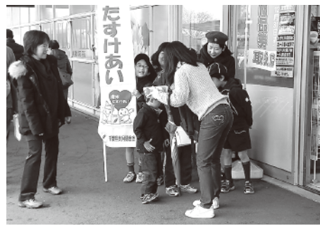
歳末たすけあい募金街頭募金