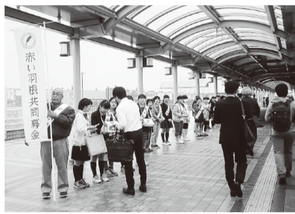
▲昨年の街頭募金活動の様子

今年も10月1日から3月31日にわたり「赤い羽根共同募金運動」が展開されています。赤い羽根募金にお寄せいただいた募金は、民間の社会福祉施設や福祉団体などの整備や運営、社会福祉協議会の行う事業費として地域の福祉活動に使われています。 昨年、印西市で市民の皆さまからお寄せいただいた募金額は、4,859,928円となりました。 皆さまの温かいご協力ありがとうございました。 お寄せいただいた募金額の総額から約70%となる3,402,000円が社会福祉協議会に配分され、ふれあい給食や一人暮らし高齢者へのふれあいハガキの発送、ボランティア講座、広報紙の発行、福祉まつりなど地域福祉事業の推進のために活用されています。 今年も町内会などのご協力による戸別募金、市内駅頭や商業施設での街頭募金、市内の企業や商店を対象とした法人募金、学校募金や職域募金など様々な募金活動を展開いたしますので、ご理解とご協力をよろしくお願いいたします。 募金活動は「寄付」という形で、いつでも参加できるボランティア活動です。 誰かのために、自分の住む町のために、皆さまからの温かいご協力の募金をお願いいたします。