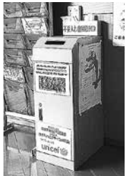
フレンドリープラザの回収BOX