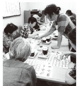
ふれあいサロン「ほっと」