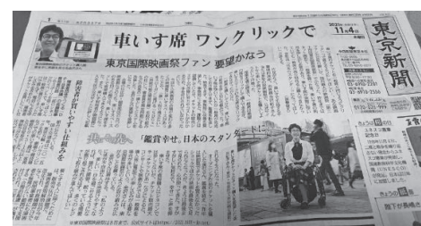
東京新聞 2021年11月4日付