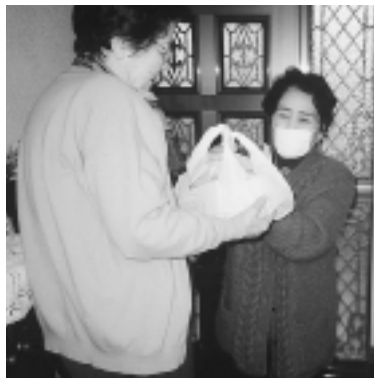
あたたかいお弁当(ふれあい給食)

です。この赤い羽根共同募金運動にお寄せいただいた善意は、一旦、千葉県共同募金会に集められ、県内の福祉施設や福祉団体の整備費や運営費に、地域配分として市町村社会福祉協議会の地域福祉事業費として使われています。