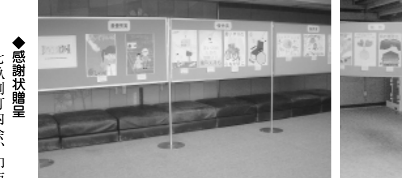
同時開催の思いやりと幸せのポスター展