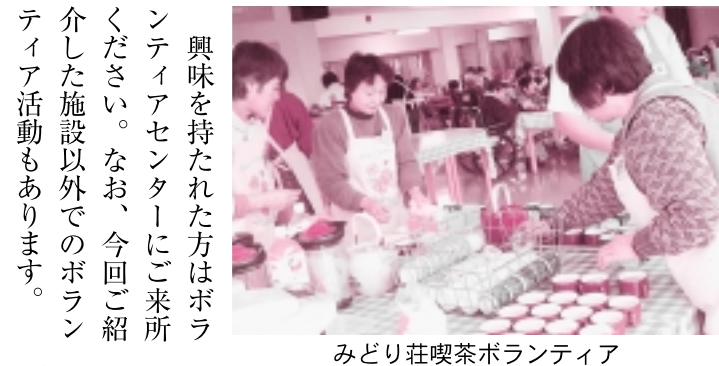
みどり荘喫茶ボランティア

ボランティアセンター TEL 42-0337 FAX 42-0338 月曜日～金曜日 9:00～16:00