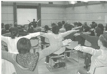
「はい、両手を肩まであげて…」