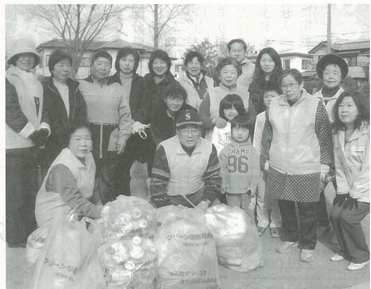
近所のみならず地域をきれいに (大森クリーンクラブ)

近年の急激な少子・高齢化の進行や厳しい財政状況等を反映してこれまでの福祉制度が前提としてきた諸条件が大きく変化しています。こうした変化に対応し、国においては、高齢者や障害者が尊厳を持って地域で普通の暮らしを続けることのできる社会づくりを目指して、医療制度、介護保険制度の見直しや高齢者虐待防止法、障害者自立支援法の制定など様々な制度改革を進めています。今後、これらの制度が地域に定着していくためにも地域福祉の