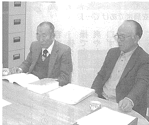
相談員が親身にお話を伺います

毎週水曜日・金曜日(祝祭日を除く) 午前10時から午後3時 (正午から午後1時は休憩) ※広報いんざいで日程をご確認下さい。