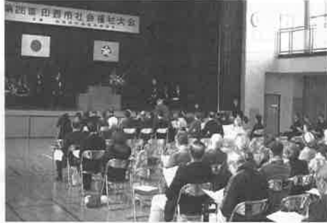
▲ 伊西市社会福祉大会

社会福祉協議会は、住民の皆様のご参加を待ち続けておりますので、引き続きご理解とご協力をお願い申し上げます。 度は以下の事業に取り組みます。 を進めるため、平成23 暮らしやすいまちづくり 民主主体並びに参加の原則のもと、『誰もが安心して暮らす』