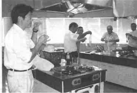
▲ 災害ボランティア養成講座