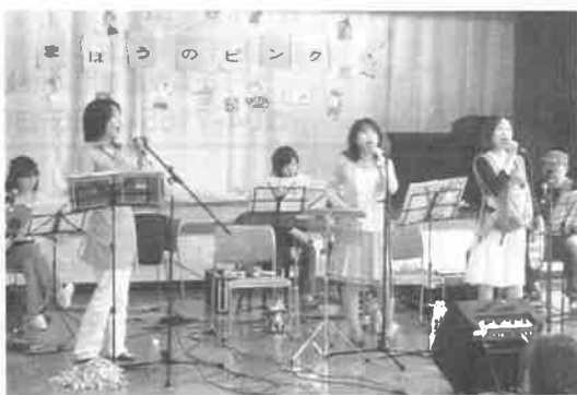
▲「魔法のピンク」のお姉さんたち♪

今年度のボランティアセンター登録状況をお知らせします。 ●ボランティアグループ登録：52団体・会員数1,156名(複数団体所属含む) ●個人ボランティア登録：66名 尚、登録ボランティアグループ一覧はボランティアセンターにございます。