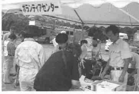
▲ 災害ボランティアセンター訓練

社会福祉協議会は、住民の皆様のご参加を待ち続けておりますので、引き続きご理解とご協力をお願い申し上げます。 度は以下の事業に取り組みます。 を進めるため、平成23 暮らしやすいまちづくり 民主主体並びに参加の原則のもと、『誰もが安心して暮らす』