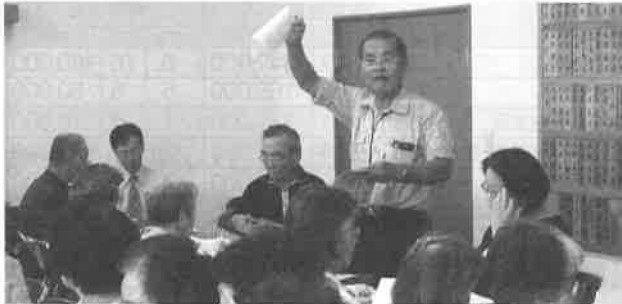
▲ 小林支部すずかけの茶屋